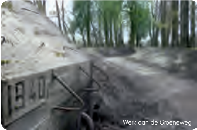
Werk aan de Groeneweg

Er is informatie over wandel- en fietsroutes, de Hollandse Waterlinie en de natuur van het rivierenlandschap.