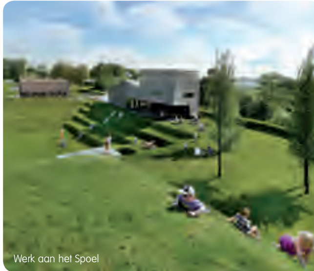
Werk aan het Spoel

Fort Everdingen sloot, samen met Fort Honswijk aan de andere kant van de Lek, de hooggelegen Lekdijk en de uiterwaarden af. De toren op het fort werd gebouwd tussen 1842 en 1847. Later zijn er nog verschillende uitbreidingen gemaakt, waaronder een fortwachterswoning en diverse bombestendige gebouwen. Bij het fort zijn drie sluizen te vinden voor de inundatie van de polder tussen de Diefdijk en Culemborg.