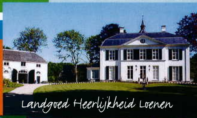
Landgoed Heerlijkheid Loenen

De wandelroute Rondje Landgoed leidt u over het prachtige Landgoed Heerlijkheid Loenen. Het landgoed bestaat al meer dan duizend jaar. Het landgoed met bijbehorende koetshuis en orangerie ligt aan de Waal in een uitgestrekt beschermd natuurgebied. Het Landgoed Loenen heeft een nat essen- en eikenbos. Er stond een kasteel op de plaats waar tegenwoordig het adellijk huis Loenen staat.